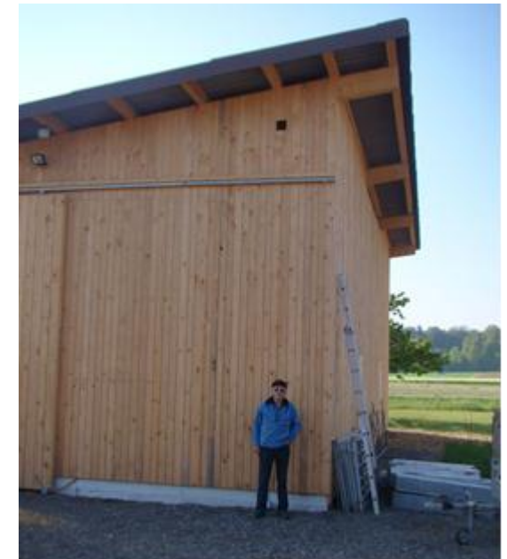
Büchslen, Dorfrand neuer Standort ab Frühjahr 2011.